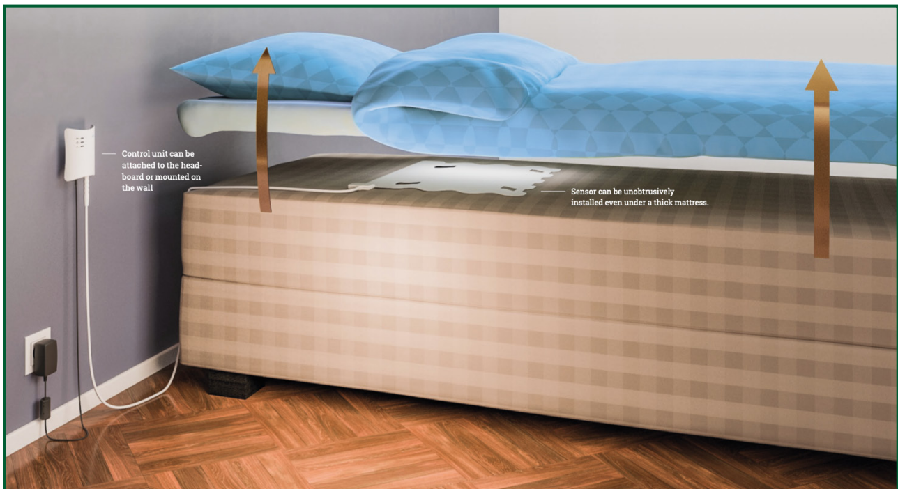
Figuur 2 Afbeelding van de Emfit matrassensor.

veel gebruikt door inwonende patiënten, maar ook door patiënten met ernstige epilepsie in andere instellingen. Ook zelfstandig wonende patiënten kunnen gebruikmaken van dit programma. Het uitgangspunt is om meerdere, mogelijk effectieve, apparaten voor aanvalsdetectie bij een patiënt te testen. Binnen Kempenhaeghe hebben we goede ervaringen met de NightWatch (figuur 1). Een grote studie van het 'TeleConsortium Aanvalsdetectie Epilepsie' toont de betrouwbaarheid van de NightWatch aan voor nachtelijke grote aanvallen (Arends et al., 2018). Een ander veel gebruikt aanvalsdetectiesysteem bij Kempenhaeghe is de Emfit matrassensor (figuur 2).