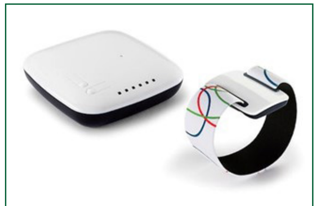
Figuur 1 Een afbeelding van de NightWatch.

In Kempenhaeghe proberen we met een groep experts (het aanvalsdetectieteam) het juiste apparaat te vinden voor een patiënt en ondersteunen we patiënten en collega's bij vragen hieromtrent. Allereerst gaan we na welke zorgen er zijn en wat het beoogde doel van aanvalsdetectie is.